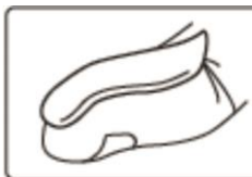
O unitate de vârf de deget

2. Aplicați cantitatea recomandată de cremă pe piele și masați ușor, până la absorbția completă a acesteia. Puteți măsura cantitatea de Derylife cu ajutorul vârfului degetului dumneavoastră. Această imagine vă arată cât reprezintă o unitate de vârf de deget.