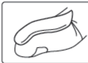
O unitate de vârf de deget